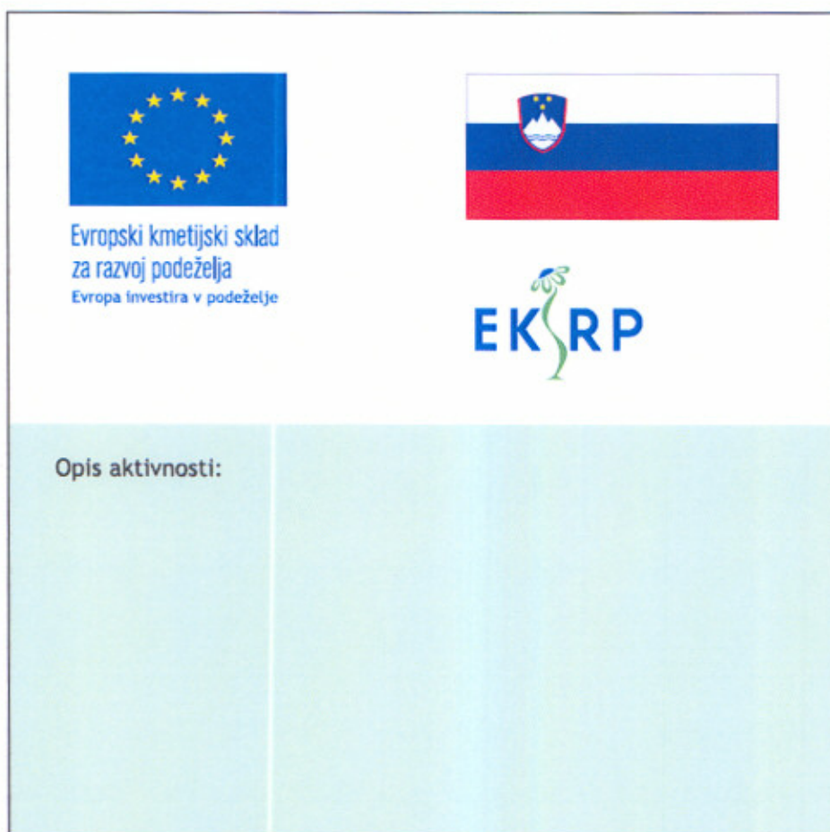
Slika 1: Dva primera obrazložitvene table oziroma panoja