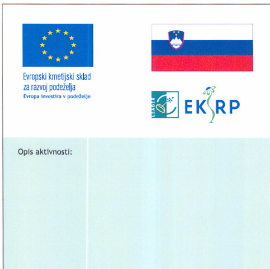
Slika 2: Dva primera obrazložitvene table oziroma panoja za aktivnosti in ukrepe, financirane iz 4. osi